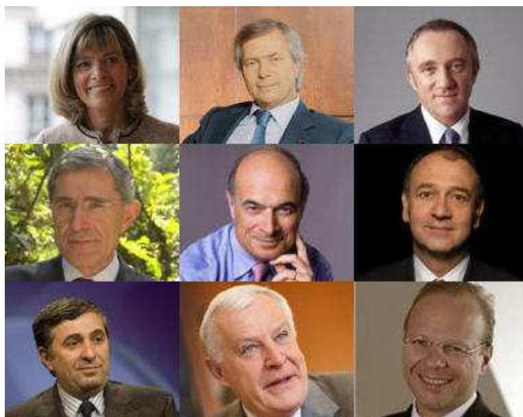
© Areva, Bolloré, PPR, Suez, EDF, Cap Gemini, GDF, Michelin, Unibail

Certaines grandes entreprises n'ont pas mis en place de régime particulier de retraites pour leur dirigeants. Leurs patrons sont donc soumis au régime général et complémentaire, ainsi qu'aux éventuels dispositifs mis en place par les entreprises pour l'ensemble de leurs salariés.