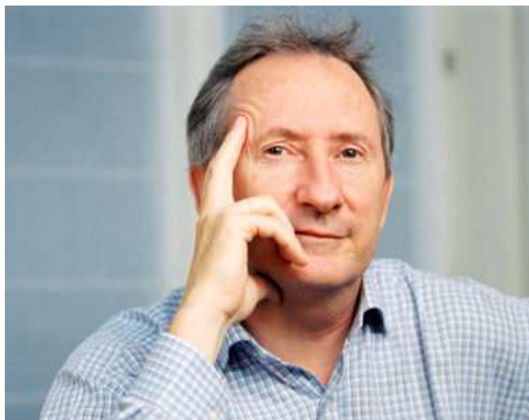
Franck Riboud

Le fils du fondateur de Danone est entré à 26 ans dans le groupe qui s'appelait alors BSN. PDG depuis 1996, il bénéficie, comme l'ensemble de la direction, d'un régime de retraite maison. Mais la rente qui lui sera versée lorsqu'il prendra sa retraite sera plafonnée à 35% des derniers salaires. Dans l'hypothèse où ses revenus n'évolueraient pas, il percevrait une retraite de 1,6 million d'euros par an.