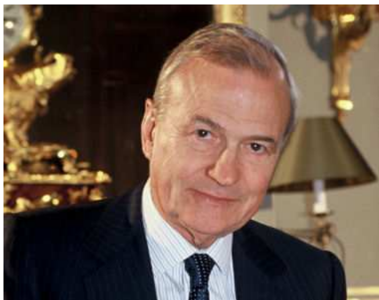
Claude Bébéar

Retraité de la compagnie d'assurance Axa, l'ancien PDG a perçu, en 2006, 433.766 euros au titre des engagements de retraite de la part d'Axa. La même année, celui qui occupe désormais la fonction de président du conseil de surveillance a gagné 123.500 euros de jetons de présence. Il possède en outre plus de 2,6 millions d'actions Axa.