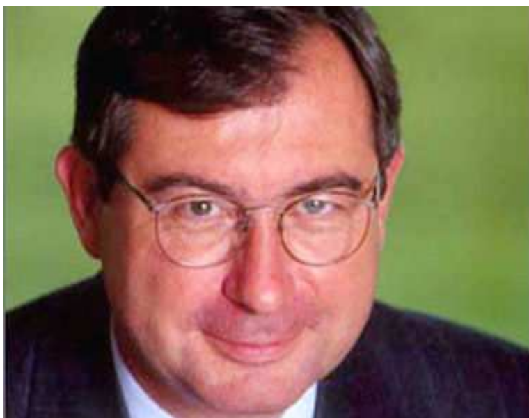
Martin Bouygues.

Si le fils du fondateur du groupe Bouygues a fait l'ensemble de sa carrière dans l'entreprises familiale, il n'est administrateur que depuis 1982. C'est seulement à partir de cette date que l'entreprise commence à cotiser pour le régime de retraite additive. Avec sa rémunération actuelle et un départ en retraite à 65 ans (en 2017), il aurait le droit à une pension de 740.000 euros par an.