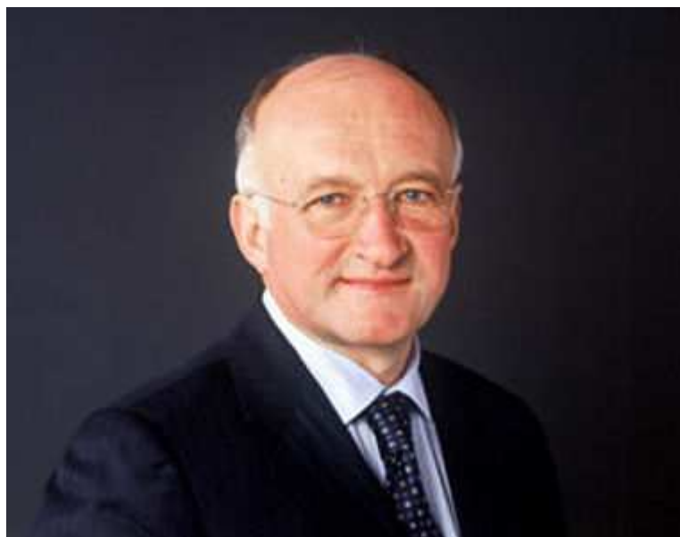
Daniel Bouton

La Société Générale a mis en place un régime de retraite supplémentaire au bénéfice de ses cadres de direction. Daniel Bouton profite bien évidemment de ce système auquel la banque cotise, année après année. Au 1er janvier 2007, Daniel Bouton avait accumulé des droits à pension équivalents à plus de 20% de sa rémunération, soit 700.000 euros.