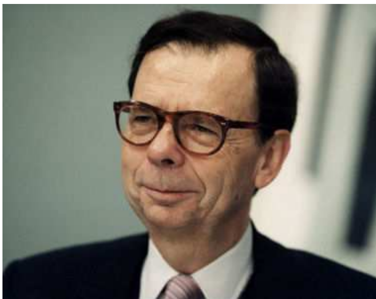
Louis Schweitzer

Même s'il n'est plus PDG de Renault, Louis Schweitzer ne perçoit pas encore sa retraite car il a pris les fonctions de président du conseil d'administration. En plus d'une indemnité forfaitaire de 200.000 euros, il reçoit de la part du constructeur automobile une rémunération fixe de 900.000 euros destinée à compenser l'absence de versement de sa pension.