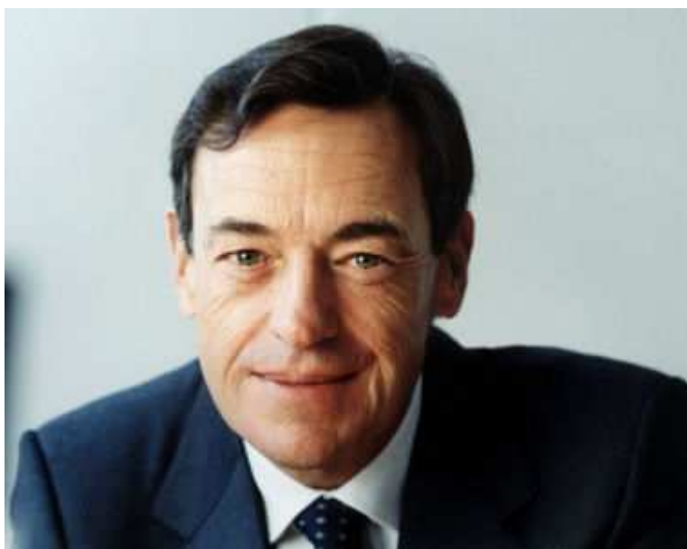
Lindsay Owen-Jones

Entré en 1969 chez L'Oréal, Lindsay Owen-Jones dispose d'une retraite record. Il avait cumulé 36 années d'ancienneté lorsqu'il a quitté ses fonctions, le 1er mai 2006.