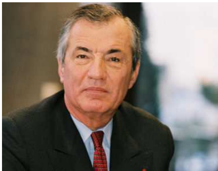
Bertrand Collomb

Le tout jeune retraité de la présidence de Lafarge perçoit une retraite complémentaire légèrement supérieure à 1 million d'euros par an. Même s'il est très élevé, ce montant correspond pourtant à un plafond . Sans cela, l'ancien patron du groupe cimentier aurait pu prétendre à une retraite de près de 1,5 million d'euros par an.