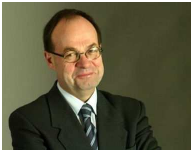
Jean-Martin Folz

Après 10 ans à la tête de PSA, Jean-Martin Folz est à la retraite depuis le 1 er mars 2007. Il bénéficie désormais d'une convention d'assurance collective qui complète les systèmes obligatoires et conventionnels. Son montant maximal atteint 50% de la moyenne des trois meilleures rémunérations entre 2001 et 2006.