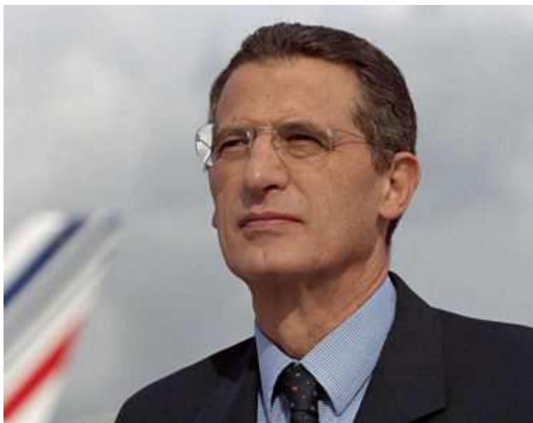
Jean-Cyril Spinetta

A la tête d'Air France depuis 10 ans, Jean-Cyril Spinetta bénéficie du régime particulier pour les cadres dirigeants de la compagnie aérienne. Ce système vise à accorder une retraite annuelle comprise entre 35 et 40 % de la moyenne des trois dernières années. Si Jean-Cyril Spinetta partait aujourd'hui, sa pension s'élèverait à 442.000 euros. Mais comme sa rémunération augmente d'année en année, ce montant va probablement continuer à croître.