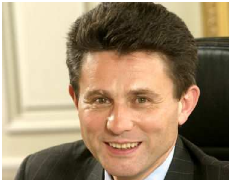
Henri de Castries

Etre l'un des patrons les mieux payés du Cac 40 assure de pouvoir bénéficier d'une retraite plus que confortable. Entré en 1989 dans l'entreprise, Henri de Castries aura normalement au moins 20 années d'ancienneté en tant que cadre dirigeant d'Axa lorsqu'il prendra sa retraite. Du coup, sa pension atteindra 40 % de la rémunération moyenne des cinq dernières années. En se basant sur la situation actuelle, Henri de Castries toucherait une retraite de près de 1,2 million d'euros par an.